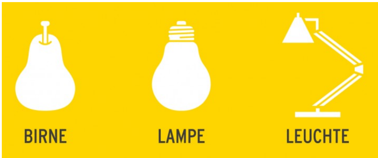
Abbildung 1: Birne – Lampe – Leuchte

Umgangssprachliche Redewendungen weichen oft von der korrekten Fachsprache ab und können für Verwirrung sorgen. Spricht man über Lampen, was ist denn nun gemeint? Ganz klar, eine „Birne“ muss gemeint sein. Eine Birne? Noch mehr Kuddelmuddel? Dieses Infoblatt bringt hier Licht ins Dunkel und sorgen für wahre Erhellung.