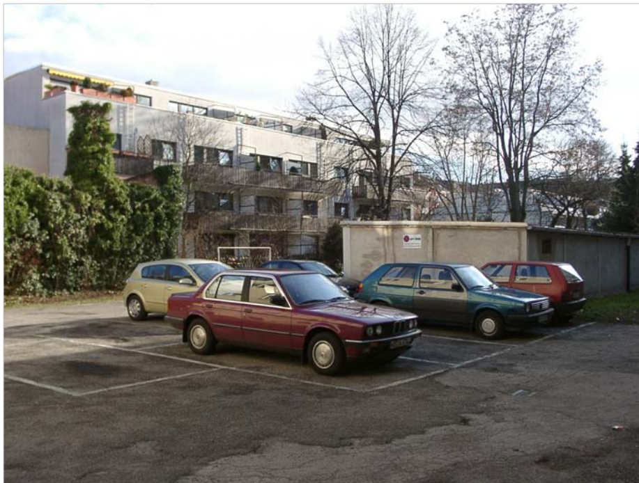
Zietenstraße 2-20, vorher