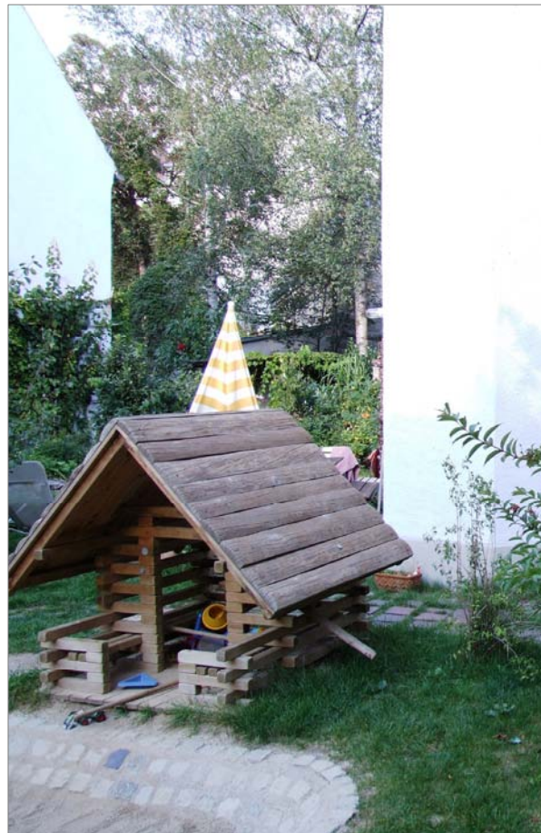
Steinstr. 45/ Milchstr.15, Haidhausen