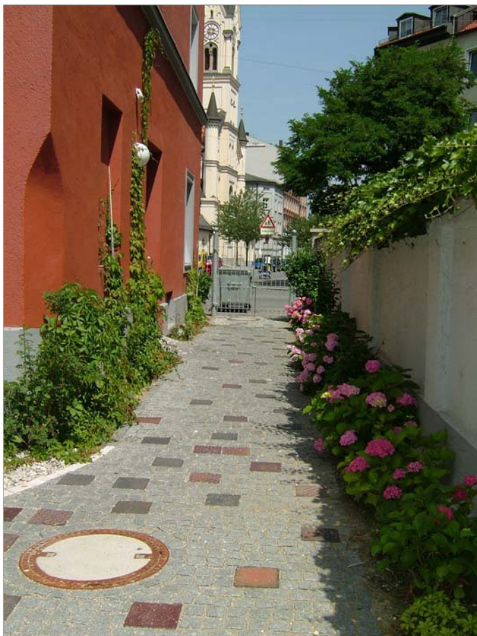
Westendstr. 83, Westend