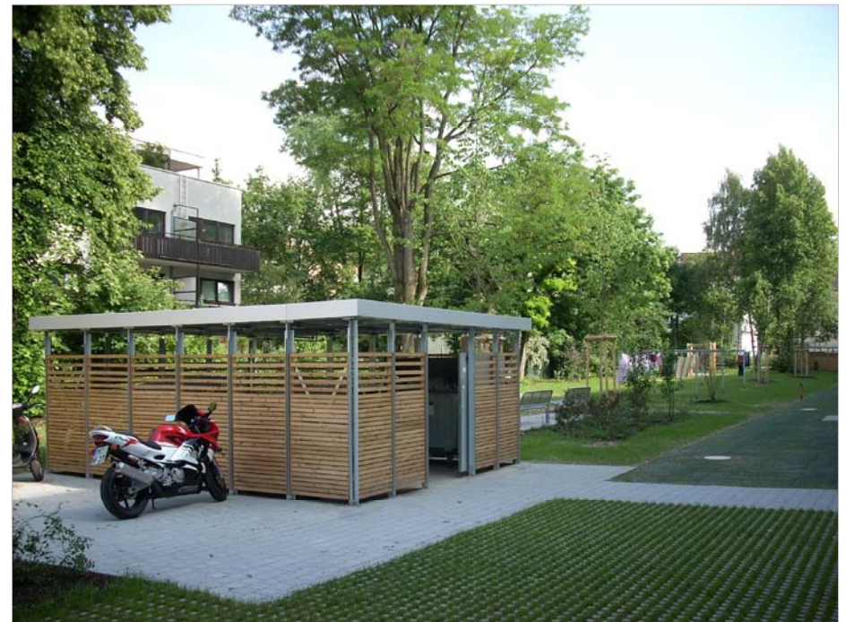
Zietenstraße 2-20, nachher