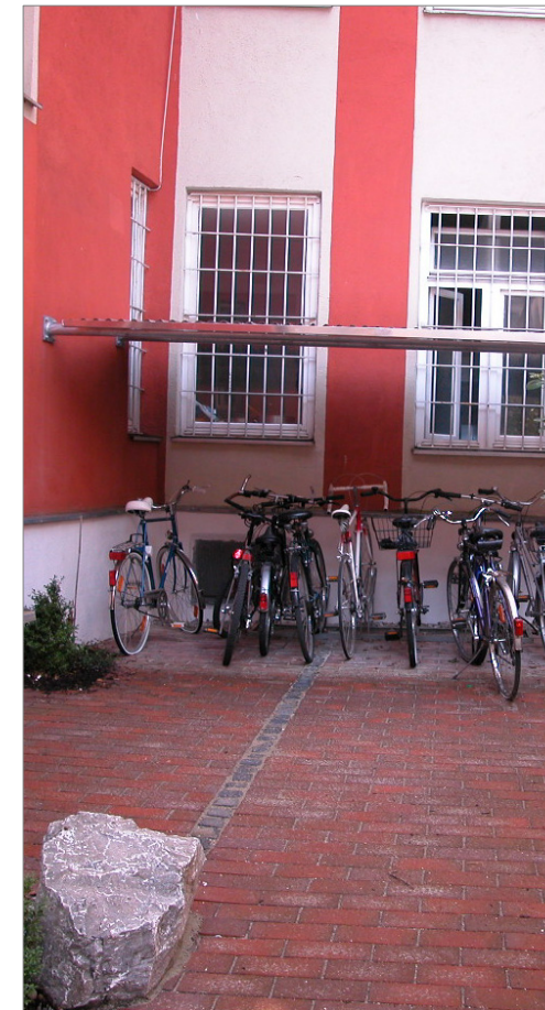
Gollierstr. 14a, Westend