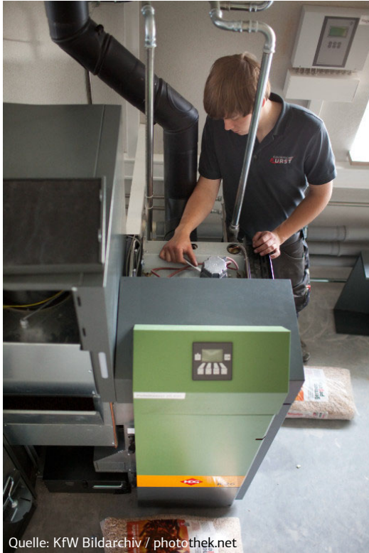
Abb. Montage einer Holzpelletsheizung