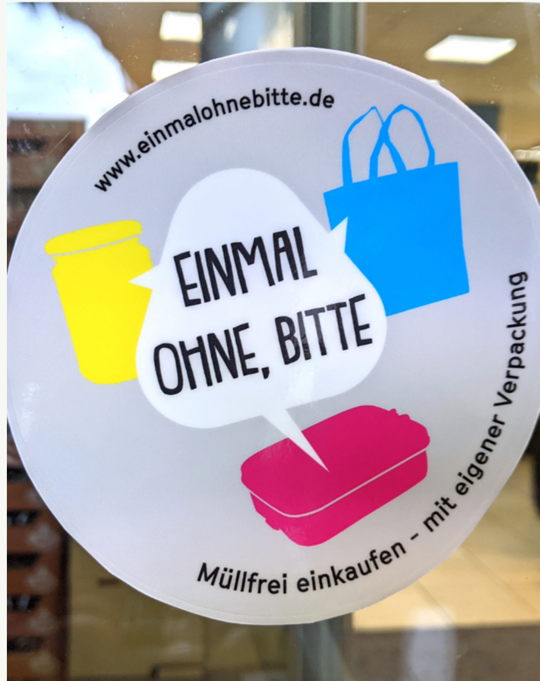
EINMAL OHNE, BITTE