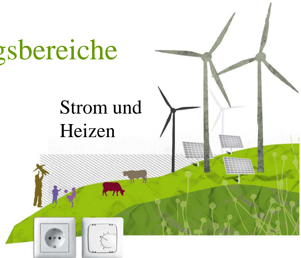
Strom und Heizen