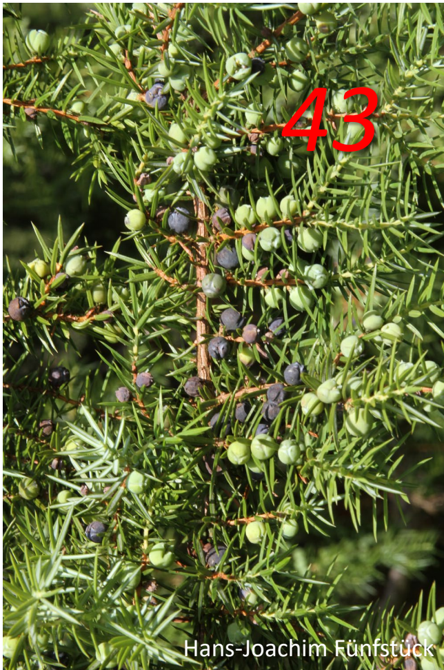
Gemeiner Wacholder Juniperus communis